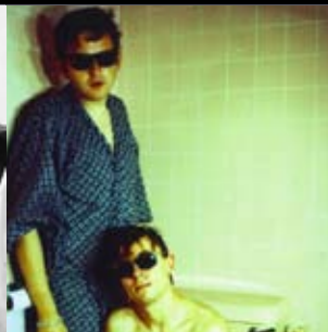
The Big Pink